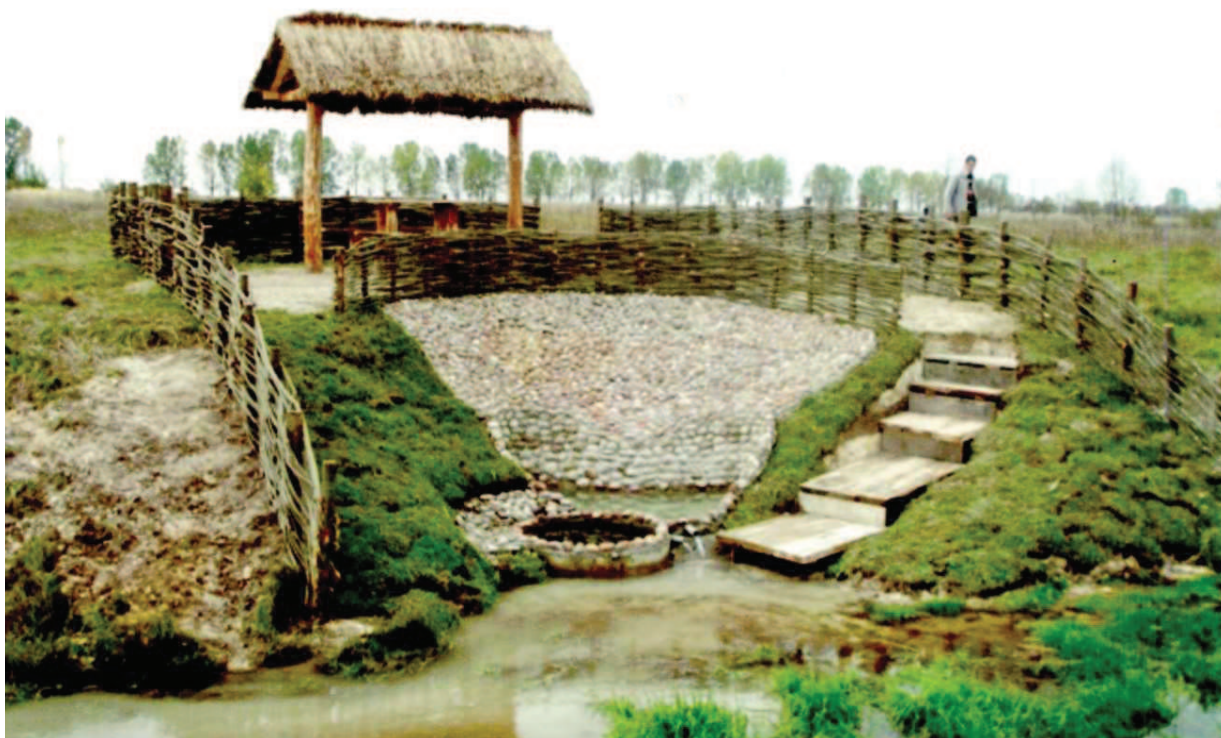
Рис. 4 Джерело «Панське» [8]

заходів покращення та підтримки їх стану [1, 10]. Таким чином, важливо чітко розрізняти які джерела знаходяться в складі ПЗФ України, які ні.