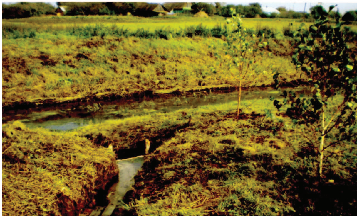
Рис. 3 Джерело «Холопичівське» [9]

ня, їх функціонування частіше всього не постійне та сезонне, якість води часто змінює свої властивості, особливо у період повеней та паводків.