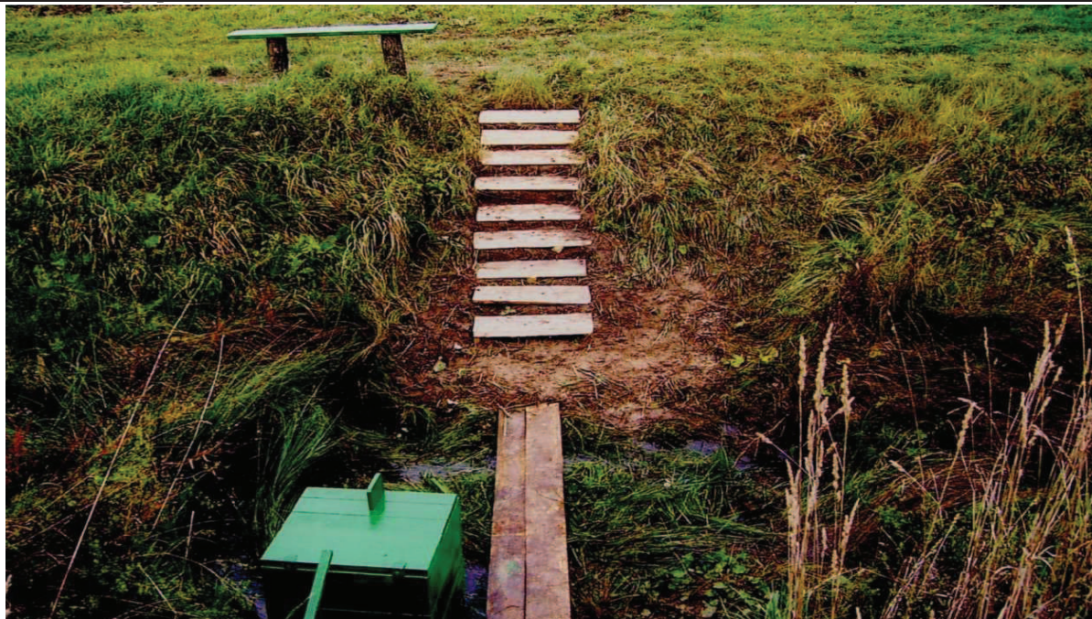
Рис. 2 Джерело «Залізничне» [7]

Серед досліджених джерел більшість (12) відноситься до класу з низьким дебітом (рис.2). Джерела такого класу не розглядаються як перспективні об'єкти водопостачан-