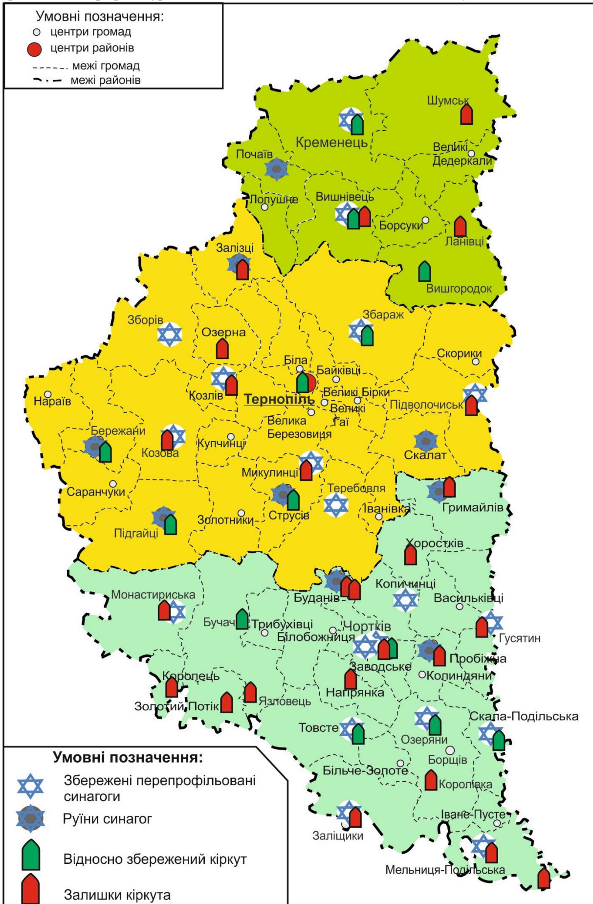
Рис. 2. Поширення і сучасний стан пам'яток єврейської культури в територіальних громадах Тернопільської області (побудовано авторами за даними [1, 9, 10])