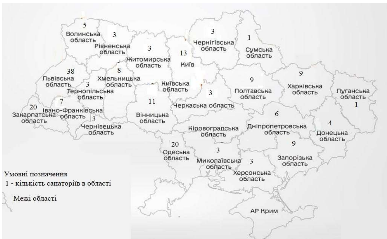
Рис.3 Поширення санаторіїв по території України в 2020 році.

жуть призвести до зменшення попиту на послуги санаторно-курортного відпочинку. Економічна нестабільність та зростання інфляції мають негативний вплив на санаторії, які змушені зменшувати свою діяльність або навіть закритися. На сьогоднішній день основною перешкодою для ведення лікувально-оздоровчого туризму – є безпека перебування туристів на території закладу (рис. 3).