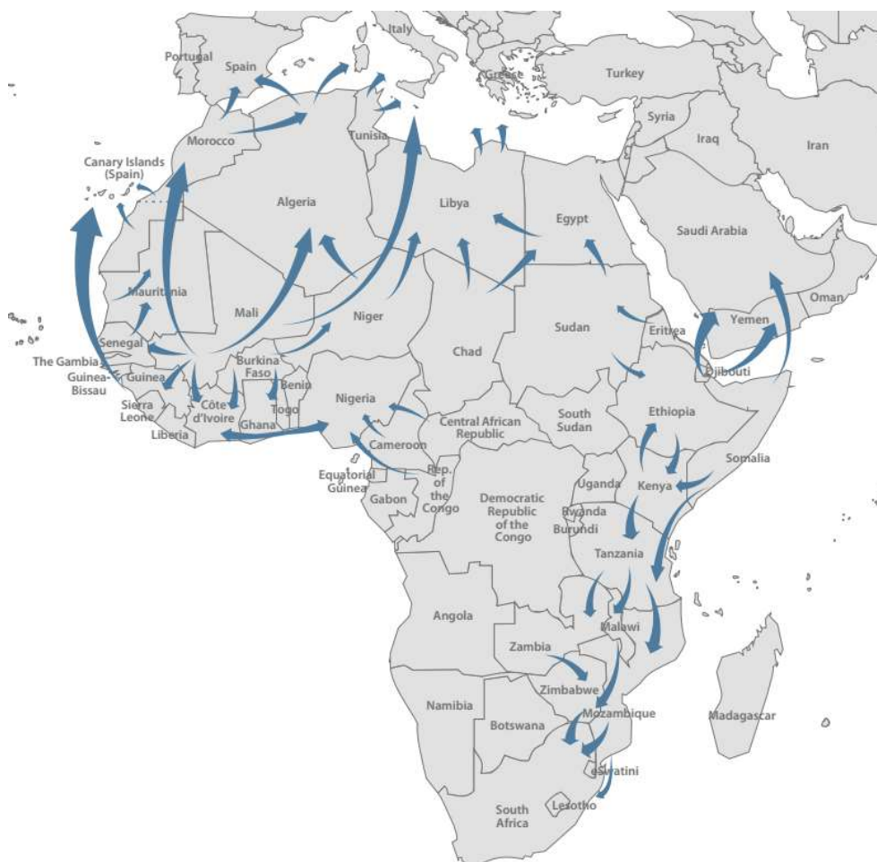
Рис. 2. Карта міграційних потоків в Африці станом на 01.01.2024 року [12]

Міжрегіональні потоки на континенті формуються насамперед під впливом економічної асиметрії між ринками праці, різниці в рівнях заробітків і темпах урбанізації, що зумовлює стійкі напрями переміщень із Західної Африки до Південної Африки, зі Східної Африки та Африканського Рогу до Південної Африки, а також із Центральної Африки до Південної та Західної Африки, де зосереджені більш диверсифіковані промислові кластери, розвинені логістичні коридори й більша місткість формального та неформального сегментів зайнятості.