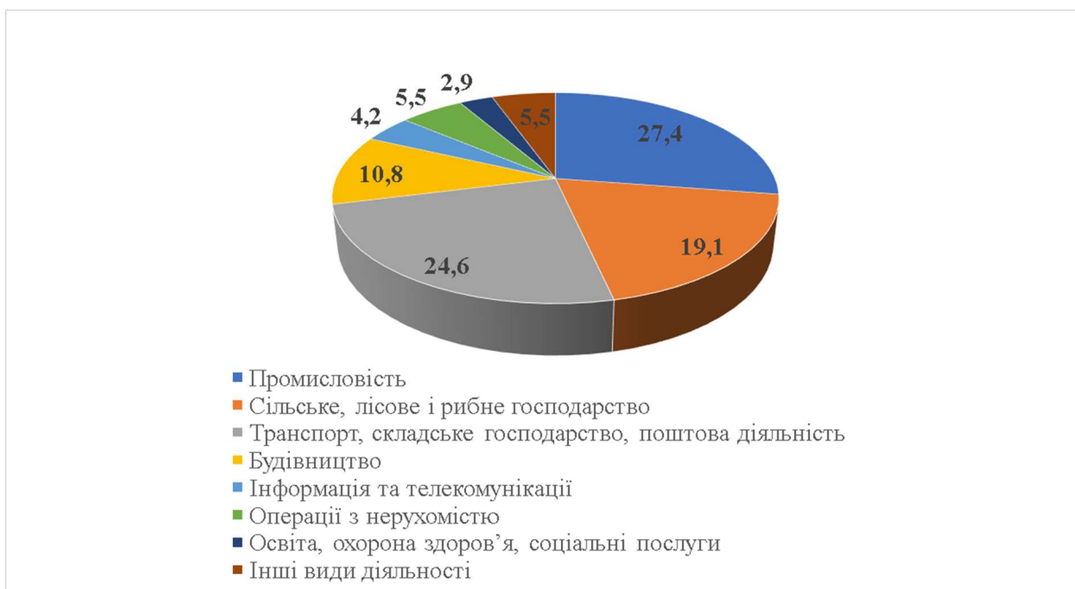
Рис.1. Структура капітальних інвестицій за видами економічної діяльності в Одеській області у 2023 році, % (складено авторами за [15])

Порівняння галузевої структури з попередніми роками показує зростання ролі аграрного сектору, що зумовлено пріоритетністю продовольчої безпеки, а також збільшенням частки транспортної сфери завдяки відновленню логістичних ланцюгів.