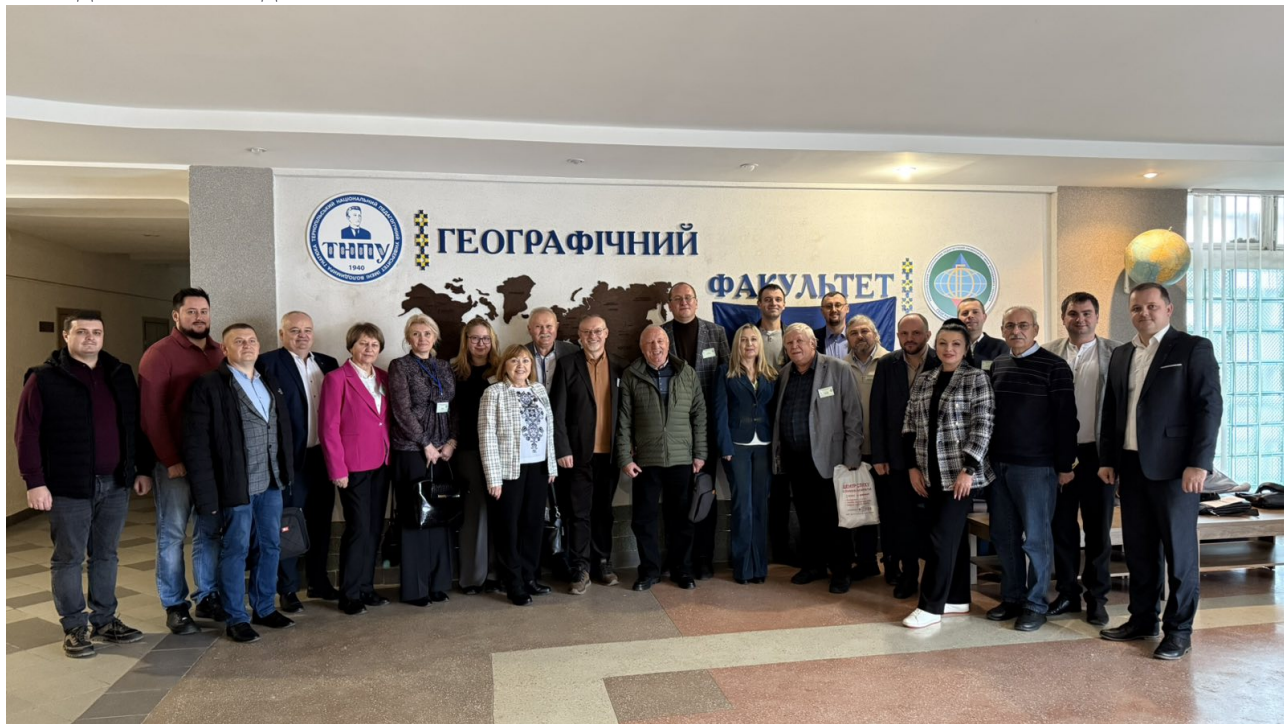
Рис. 1. Колективне фото учасників конференції.

У конференції взяли участь науковці, представники закладів вищої освіти України, серед яких: Львівський національний університет імені Івана Франка, Харківський національний університет імені В. Н. Каразіна, Кам'янець-Подільський національний університет імені Івана Огієнка, Київський національний університет імені Тараса Шевченка, Уманський національний університет, Хмельницький національний університет, Волинський національний університет імені Лесі Українки, Вінницький державний педагогічний університет імені Михайла Коцюбинського, Кременецька обласна гуманітарно-педагогічна академія ім. Тараса Шевченка, Тернопільський обласний комунальний інститут післядипломної педагогічної освіти.