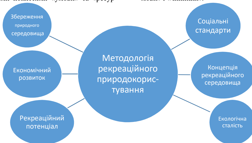
Рис.2. Концептуальні аспекти розвитку рекреаційного природокористування

си», а непрямі складові — поняттями «передумови» і «чинники».